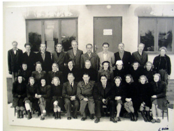
Personalen samlade utanför fabriken år 1947. På museet finns namnen på personerna på bilden